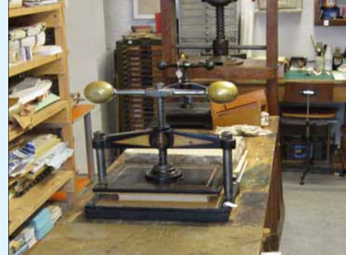
Et udsnit fra bogbinderiet.

Wir reparieren alte Bücher in der Buchbinderei. und Drucken, die beschädigt wurde.