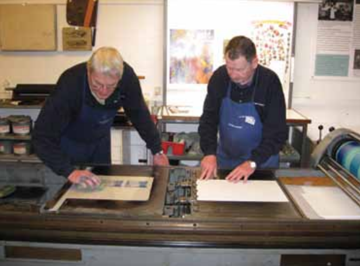
Offsetprøvetrykkes fra 50'erne leveret af Pakkotryk