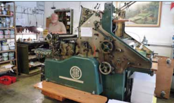
Eickhoff cylinder fra ca. 1955.