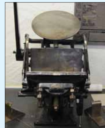
Fluesmækkere til at trykke servietter på.