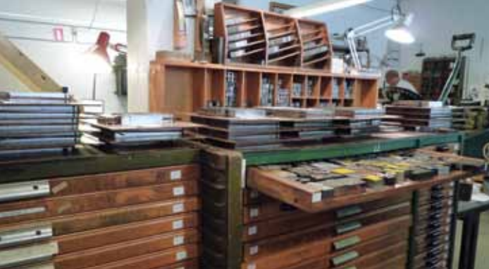
Satsreoler i en gade i sætteri.