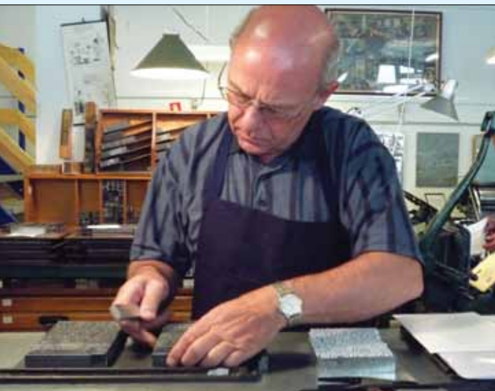
Ombrydning af sider til en bog. Linotype sættemaskine fra ca. 1940.

Aktuelle åbningstider: Onsdag kl. 10.00 - 14.00 Lørdag kl. 10.00 - 13.00 og efter aftale